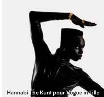
Hannabi The Kunt pour Vogue in Lille