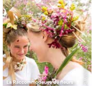
La Racommodeuse de fleurs