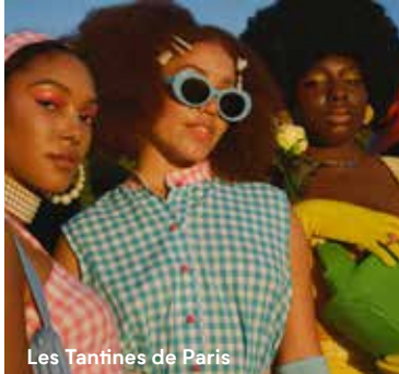
Les Tantines de Paris